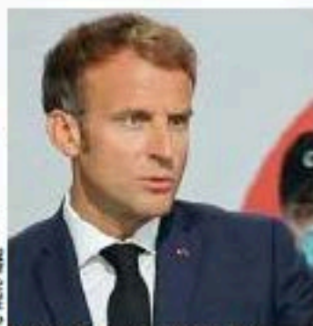
Emmanuel Macron promet des moyens financiers et humains importants pour renforcer la sécurité.

M. Macron a également annoncé la mise en place d'« une instance de contrôle parlementaire des forces de l'ordre », sur le modèle de la délégation parlementaire au renseignement. Une manière de répondre aux critiques visant